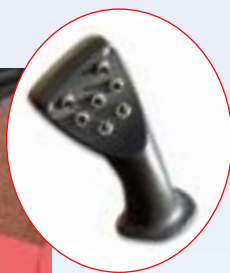
Réglages automatiques ou manuels