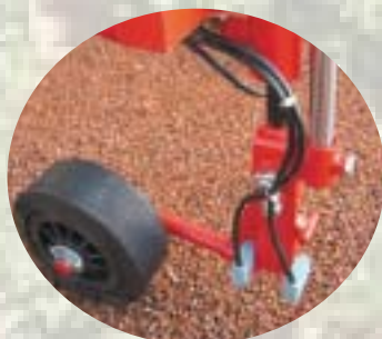
Correction automatique de dévers par capteurs