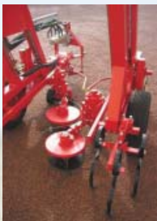
Mise en œuvre rapide d'outils interceps mécaniques et/ou hydrauliques