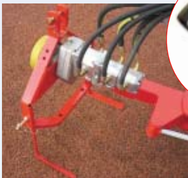
Centrale hydraulique autonome sur attelage 3 points standard