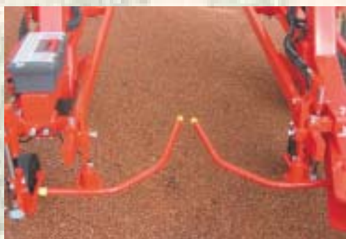
Auto-centrage par palpeurs